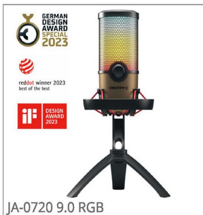
JA-0720 9.0 RGB