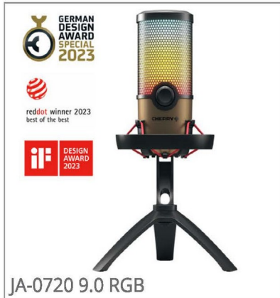
JA-0720 9.0 RGB